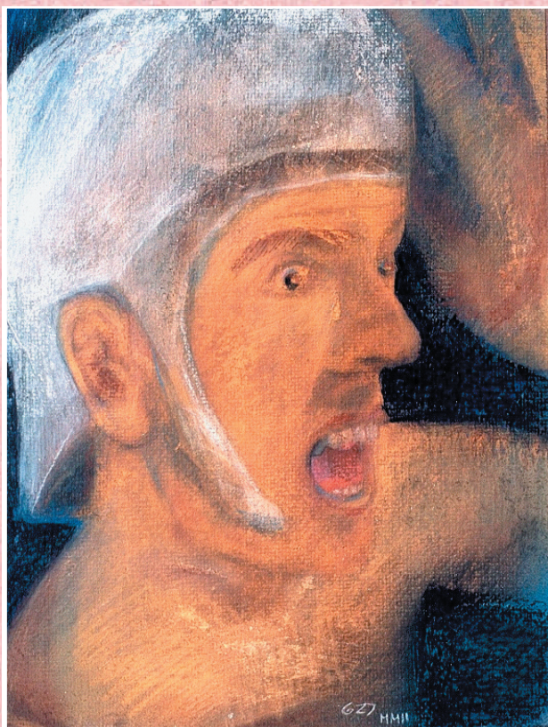
GUERRERO GRITANDO. A4. Pastel s/ cartulina. 2002