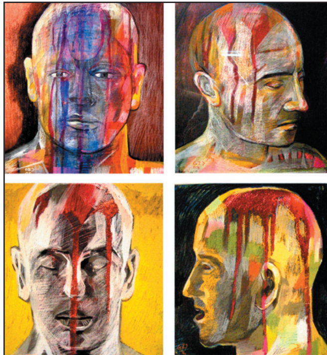
ENSANGRENTADOS. Cuatro secuencias. 29 x 28. pastel y acuarela s/ cartulina negra. 2003

Web oficial: www.gczarrias.com / www.pinturactual.com / Batiburrillo / FluidoRosa RNE 3. Galería 5 / www.terrenoculto.com / www.interarteonline.com / www.elmuseodelraton.com / www.talleronline.com / El taller de Robert Coane. / www .